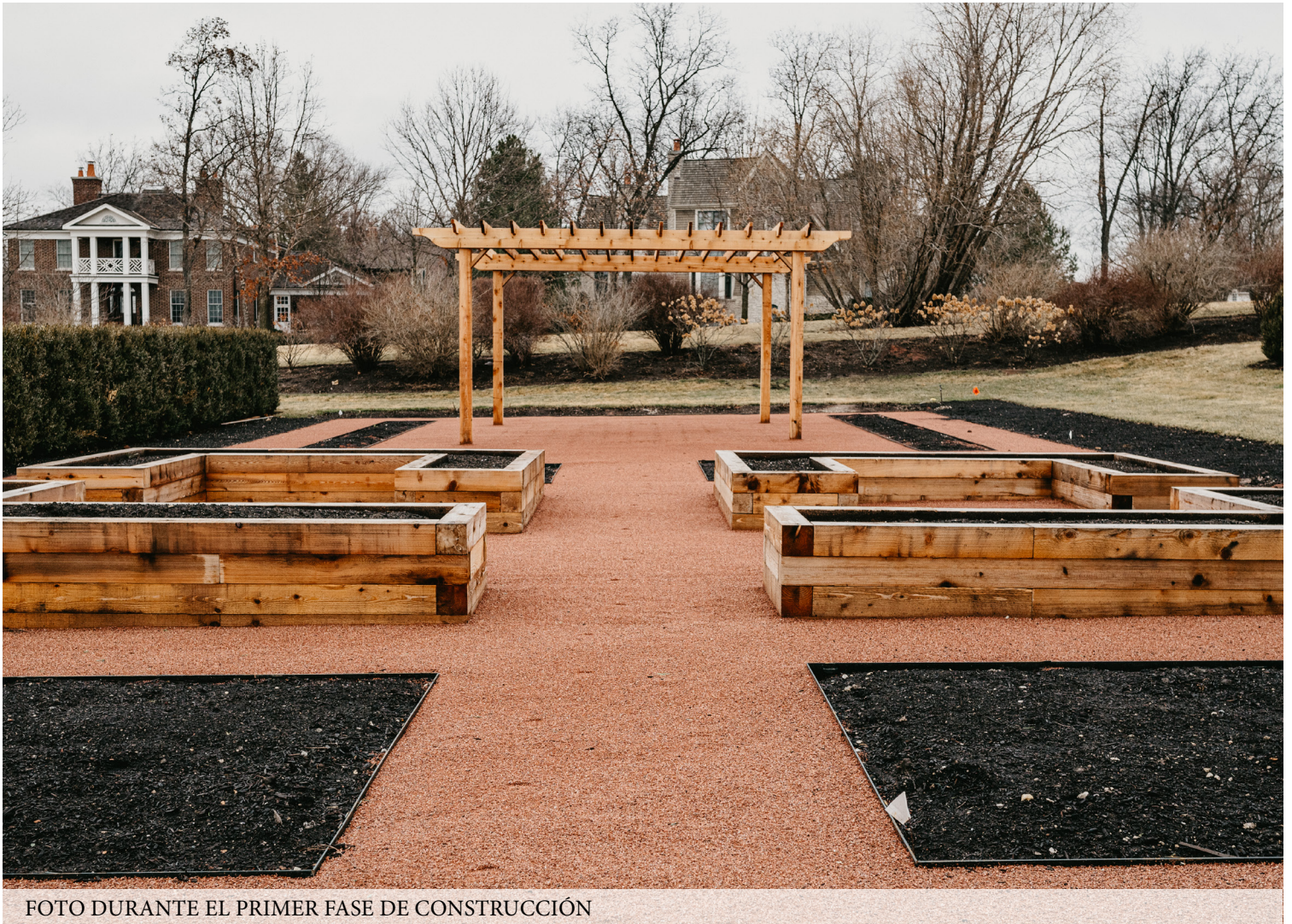
FOTO DURANTE EL PRIMER FASE DE CONSTRUCCIÓN